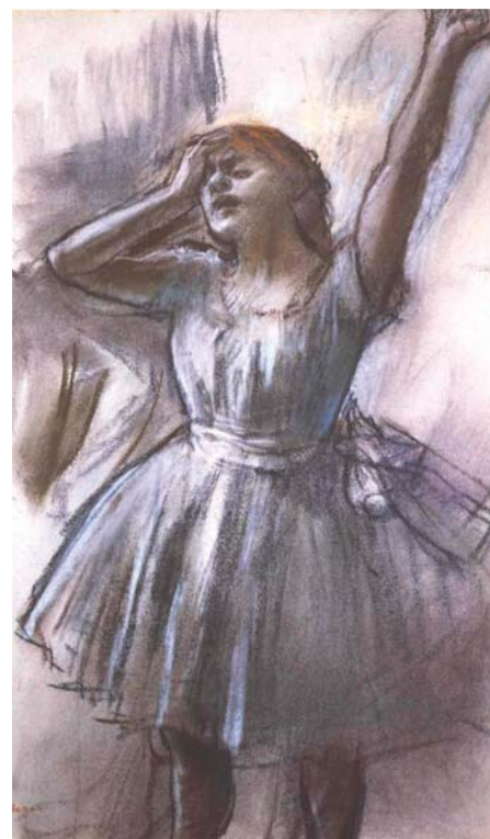
Edgar Degas: Exhausted Dancer