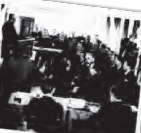
Den første skole i fengselsvesens historie er åpnet på Botsfengslet idag. Det er første gang i fengselsvesens historie i Norge at man har gitt de som skilles fra samfunnet ferdigheter og utdanning.

Det vil bli en milepæl i vårt fengselsvesens utvikling. Det er første gang i fengselsvesens historie i Norge at man har gitt de som skilles fra samfunnet ferdigheter og utdanning. Det er også viktig å lære å håndtere seg selv og å bli en ansvarlig fanger. Det er også viktig å lære å samarbeide med andre fanger og å bli en del av et fellesskap.