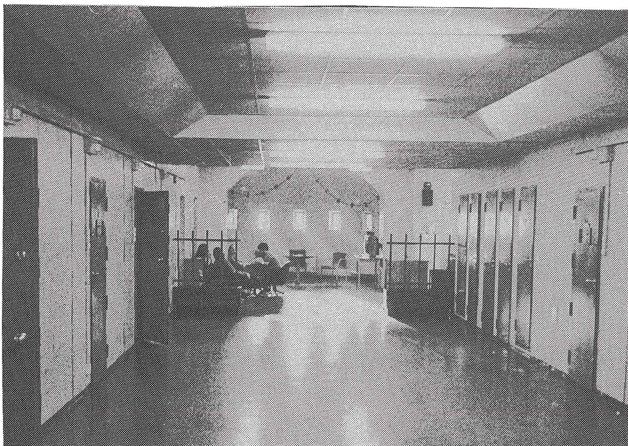
Bildet viser en fellesskapsavdeling ved avd. A/Botsfengslet. Innerst ser vi oppholdsrommet for fangene, populært kalt for "fellesskapet".

Avd. A kan med andre ord karakteriseres som et halvåpent fengsel med et helt annet grunnlag for fangefellesskap enn det som er tilfelle ved avd. B. Fellesskapet har også andre implikasjoner for samhandlingen mellom betjenter og innsatte i avdelingene. Avdelingsbetjenten ved avd. B vil stort sett kunne forholde seg til innsatte enkeltvis, mens avdelingsbetjenten ved avd. A som oftest vil måtte forholde seg til grupper av innsatte.