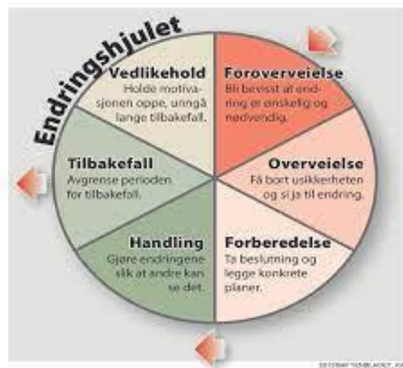
Figur 2: Endringshjulet